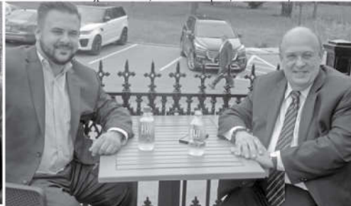
Ο Honourable Micahel Tibollo με συνεργάτη του