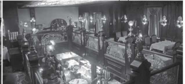
Μια από τις πολύ εντυπωσιακές αίθουσες του David Duncan House