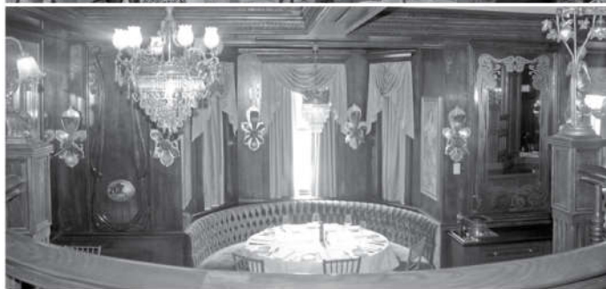
Πανοραμική όψη εντυπωσιακής αίθουσας του David Duncan House